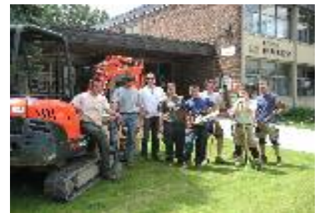
Chantier école au Québec