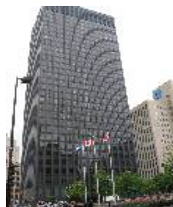
Mobilité internationale Québec et République Tchèque

Gratuité de la formation (Formation financée par le Conseil Régional Rhône Alpes et la taxe d'apprentissage).